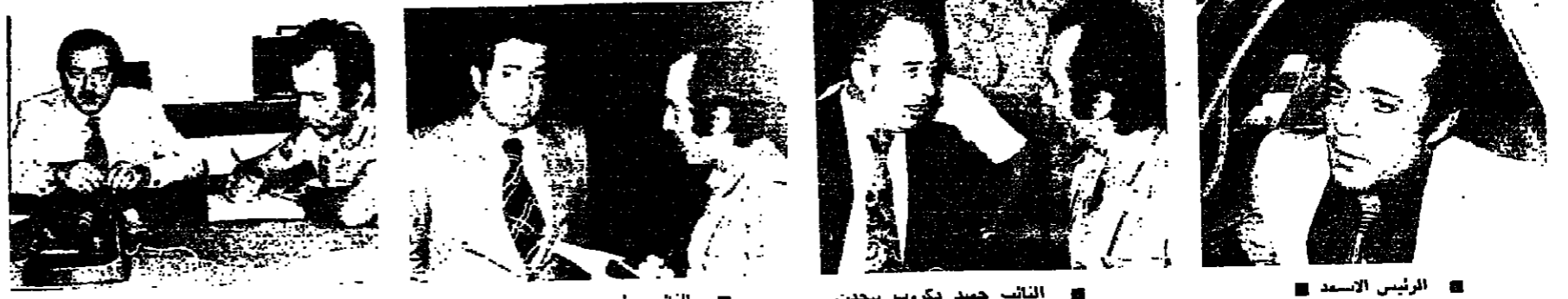
الرئيس الأسد ■ النائب حيدر كزوب يتحدث ■ النائب بطرس حرب ■ النائب زكي مزويدي